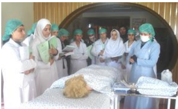
Formation de sages-femmes à Pole Alam

MRCA (Cours Médicaux de Recyclage pour Afghans) est une ONG française exclusivement dédiée à la santé. Fondée en octobre 1985 à Paris, elle a fourni de 1986 à 2004 aux Afghans réfugiés au Pakistan des services médicaux dans le cadre d'un Hôpital/Centre de formation à Peshawar. MRCA s'est aussi implantée en Afghanistan, à Chak-e Wardak de 1994 à 1997, à l'hôpital Maïwand de Kaboul depuis 1996, à l'hôpital provincial de Charikar (Parwan) de 2002 à 2004, dans la province du Logar depuis décembre 2004, et dans celle de Baghlan depuis novembre 2006.