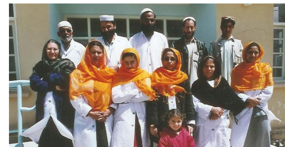
Le staff du Centre d'urgences obstétriques de Mango (Kharwar)

DONATEURS PRINCIPAUX. Pour l'essentiel, MRCA atteint ses objectifs avec le soutien financier de l'Union Européenne, du Gouvernement français, de l'Ambassade du Japon en Afghanistan, de l'UNFPA, de l'Organisation mondiale de la santé (OMS) et de la Banque mondiale.